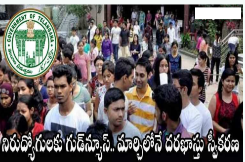
నిరుద్యోగులకు గుడెస్సాస్, మార్చిలోనే దరఖాస్తు స్వీకరణ అందిస్తామని చెప్పారు. ఇందుకోసం రూ.6000 కోట్లను కేటాయించనున్నట్లు వెల్లడించారు. ఒక్కొక్కరికి అందించే ఆర్థిక సహాయంలో బ్యాంకు లింకేజీ ఉంటుందన్నారు. రూ.3 లక్షల పూర్తిగా సబ్సిడీ? బ్యాంకు రుణమా? ఎంత శాతం సబ్సిడీ? అనే వివరాలను త్వరలో వెల్లడిస్తామని భట్టి చెప్పారు. విధివిధానాలు, లబ్ధిదారుల అర్హతలు వంటి వివరాలను కూడా ప్రకటిస్తామన్నారు. లబ్ధిదారుల వయసు 55 ఏళ్లకు మించి ఉండరాదని తెలిపారు. పథకానికి సంబంధించి ఈ నెల 15న నోటిఫికేషన్ జారీ

ఉపాధి పథకాలను అందించాలని సీఎం రేవంత్ రెడ్డి నిర్ణయం తీసుకున్నారు. ఎస్సీ అభివృద్ధి, గిరిజన సంక్షేమ శాఖలు సీఎం వద్ద, బీసీ సంక్షేమ శాఖ పొన్నం ప్రభాకర్ వద్ద ఉన్నాయని తెలిపారు. యువతకు స్వయం ఉపాధి కల్పించాలన్న ఉద్దేశంతో వారు కార్యచరణ ప్రణాళికను రూపొందించారన్నారు. ఇప్పటికే టీజీపీఎస్సీ ద్వారా ఉద్యోగాలను భర్తీ చేస్తూ నిరుద్యోగులకు ఉద్యోగావకాశాలు కల్పిస్తున్నామని, ఇంకా మిగిలిపోయిన వారికి స్వయం ఉపాధి పథకాలను అందించాలని నిర్ణయించామని చెప్పారు. అందులో భాగంగానే రాజీవ్ యువ వికాసం పథకాన్ని అమలు చేయాలని నిర్ణయించినట్లు తెలిపారు. ఈ పథకం కిందో ఒక్కో ఎస్సీ, ఎస్టీ, బీసీ, మైనారిటీ నిరుద్యోగికి రూ.3 లక్షల వరకు ఆర్థిక సాయాన్ని అందిస్తామన్నారు. రాష్ట్రంలోని 5 లక్షల మంది నిరుద్యోగ యువపతి యువకులకు ఈ సాయం