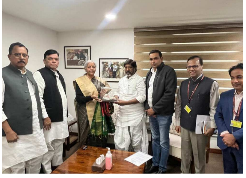
(మొదటి పేజి (తరువాయి))

వేగవంతం చేయాలని విజ్ఞప్తి చేశారు. ఆంధ్రప్రదేశ్ పునర్వ్యవస్థీకరణ చట్టం 2014 విభాగం 94(2) ప్రకారం, వెనకబాటు జిల్లాల కోసం తెలంగాణకు ప్రత్యేక సహాయ నిధి విడుదల చేయాలని భట్టి కోరారు. ఆంధ్రప్రదేశ్ పునర్వ్యవస్థీకరణ చట్టం 2014లోని విభాగం 56(2) ప్రకారం, రూ.208.24 కోట్లు తెలంగాణకు తిరిగి చెల్లించాలని విజ్ఞప్తి చేశారు. ఆంధ్రప్రదేశ్ పవర్ షాన్ కార్యారంభం నుంచి తెలంగాణ పవర్ షాన్ కార్యారంభం కేటాయింపు అదనపు బాధ్యత మేరకు రావాల్సిన మొత్తానికి సంబంధించిన అంచనైనా చర్చ సాగింది.