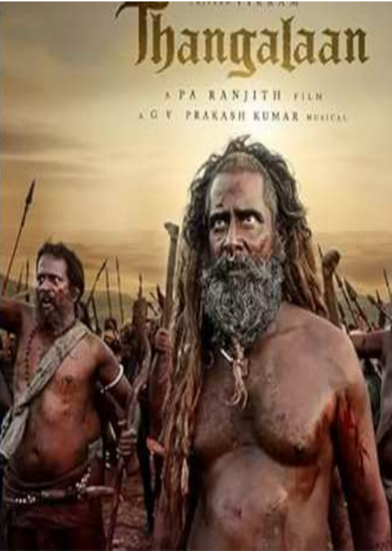
కనెక్ట్ అయ్యారు. తమిళ స్టార్ హీరో విశ్వక్, దర్శకుడు రంజిత్ కాంబినేషన్లో తెరకెక్కిన చిత్రం తంగలాన్. గతేడాదిలో విడుదలైన ఈ చిత్రం భారీ విజయాన్ని అందుకుంది. ఈ చిత్రం ప్రస్తుతం నెట్టింటి వేదికగా ట్రిమింగ్ అవుతోంది.