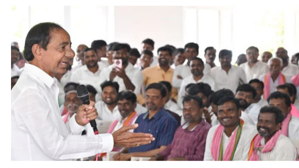
కాంగ్రెస్ ప్రభుత్వంపై వ్యతిరేకత మిగతా 2లో...