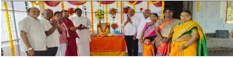
చింతపల్లి, సూర్య సూర్య టండే న్యూస్ ప్రతినధి జనవరి 30