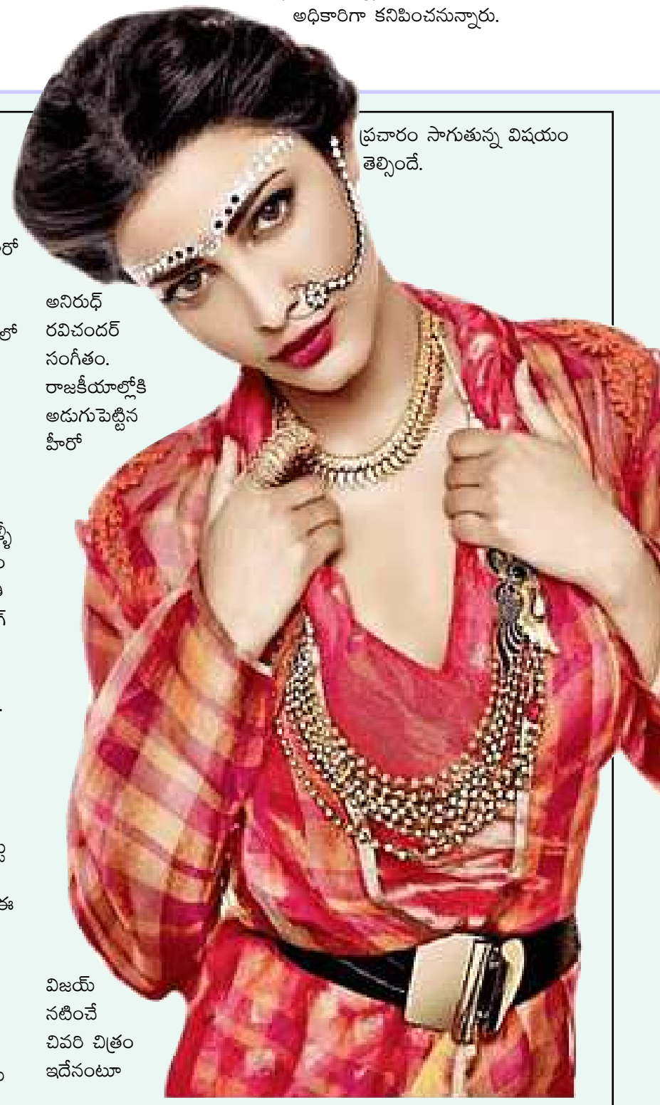
ప్రచారం సాగుతున్న విషయం తెల్పిందే.

అగ్రహీరో విజయ్ నటిస్తున్న 69వ చిత్రంలో హీరోయిన్ శృతిహాసన్ ఓ ముఖ్య పాత్ర పోషించనున్నట్లు ప్రచారం జరుగుతుంది. గతంలో విజయ్ సరసన 'పులి' సినిమాలో శృతి హీరోయిన్ గా నటించారు. సుదీర్ఘకాలం తర్వాత వీరిద్దరూ మళ్ళీ కలిసి నటించబోతున్నారు. ప్రస్తుతం రజనీకాంత్ 'కూలీ' సినిమాలో శృతి నటిస్తున్నారు. ఈ సినిమా షూటింగ్ థాయ్ లాండ్ లో జరుగుతుంది. రజనీకాంత్, శృతిహాసన్ ఇటీవలే థాయ్ నుంచి చెన్నై తిరిగి వచ్చారు. అదే సమయంలో విజయ్ 69వ చిత్రం 'జన నాయగన్' షూటింగ్ సగర శివారు ప్రాంతమైన పన్నెయ్యూరులో జరుగుతుంది. ఈ షూటింగ్ లో శృతిహాసన్ పాల్గొన్నట్లు కోలీవుడ్ వర్గాల సమాచారం. హెచ్.వి.నోద్ దర్శకత్వం వహించే ఈ చిత్రంలో బాబీ డియోల్, మమితా బైజు, గౌతం వాసుదేవ మేనన్, ప్రకాష్ రాజ్, వరలక్ష్మి, డీజే అరుణాచలం తదితరులు నటిస్తున్నారు. కేవీఎన్ ప్రొడక్షన్స్ పతాకంపై రూపొందే ఈ సినిమాకు