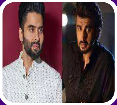
రోజులు అయ్యిందని.. అదృష్టవశాత్తూ, ఎవరూ తీవ్రంగా గాయపడలేదని తెలిపాడు.

టాలీవుడ్ నటుడు అర్జున్ కపూర్ కి నిర్మాత రకుల్ ప్రీత్ సింగ్ భర్త జాకీ భగ్నానీకి మాటింగ్ లో ప్రమాదం జరిగింది. ఈ విషయాన్ని నిర్మాణ సంస్థ ఆలస్యంగా వెల్లడించింది. అర్జున్ కపూర్ ప్రధాన పాత్రలో నటిస్తున్న తాజా చిత్రం 'మేరే హ్యాండ్ కి బీబీ'. ఈ సినిమాకు రకుల్ ప్రీత్ సింగ్ భర్త జాకీ భగ్నానీ నిర్మిస్తున్నాడు. ప్రస్తుతం ఈ సినిమా మాటింగ్ జరుపుకుంటుండగా..