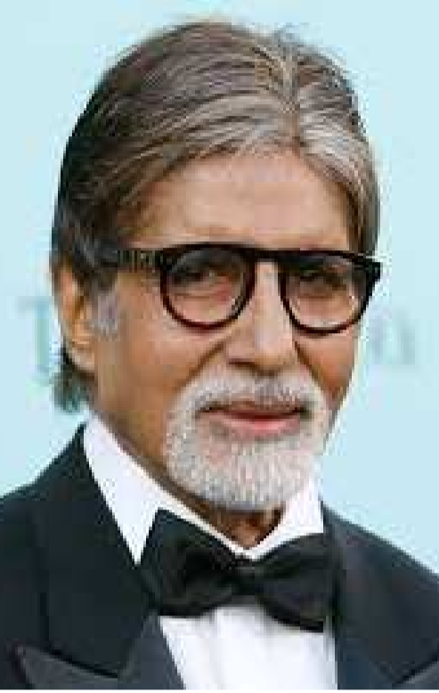
కోట్లకు కొనుగోలు చేయగా.. ప్రస్తుతం రూ.83 కోట్లకు అమ్మారు. అంటే రూ.52 కోట్లు లాభం అన్నమాట. ఇది విలువపరంగా 168 శాతం గణనీయంగా పెరిగింది. బిగ్ బి ఈ అపార్ట్ మెంట్స్ నటి కృతినననకు నవంబర్ 2021లో అద్దెకు కూడా ఇచ్చాడని తెలిసింది. మొత్తానికి తనదైన స్ట్రాటజీతో లాభాలు గడిస్తూ బిజినెస్ ప్లాన్ లో చాలా మందికి స్ఫూర్తిగా నిలుస్తున్నాడు బిగ్ బి.

పత్రాలతో సహా ఈ వివరాలను పొందుపరిచింది. ఓషివారా పశ్చిమ ముంబై సమీపంలోని లోఖండ్ వాలా కాంప్లెక్స్ లోకి వేసిన ఈ రెసిడెన్షియల్