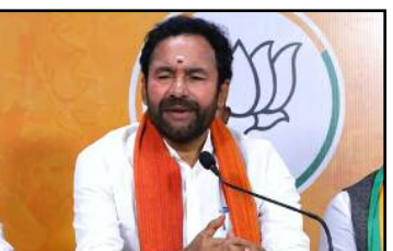
మండిపడ్డారు. పీవీ నర్సింహారావు భౌతిక శాస్త్రాన్ని హైదరాబాద్ కు పంపించారన్నారు. మన్మోహన్ సింగ్ మృతి దేశానికి తీరని లోటు అన్నారు. >>>4లో

శాసనసభ / హైదరాబాద్ : తెలంగాణ వాడైన పీవీ నర్సింహారావు పట్ల సోనియా గాంధీ అమర్యదగా ప్రవర్తించారని కేంద్రమంత్రి కిషన్ రెడ్డి విమర్శించారు. కాంగ్రెస్ పార్టీ సాధారణ నాయకుడికి దక్కిన గౌరవం కూడా మన తెలంగాణ బిడ్డ పీవీకి అనాడు దక్కలేదని ఆవేదన వ్యక్తం చేశారు. పీవీ అంతిమ సంస్కారాలు ఢిల్లీలో జరపడానికి వీల్లేదని సోనియా నాడు హకుకు జారీ చేశారని