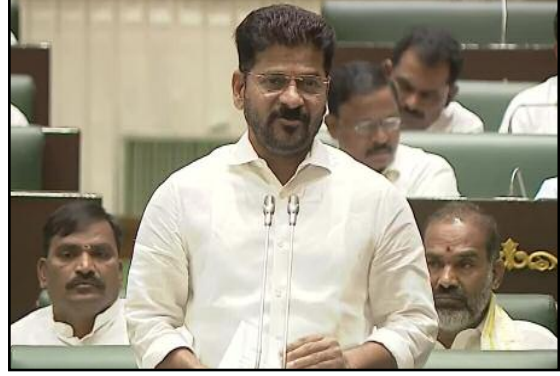
అనుమతించడానికి ఆదేశాలిచ్చిన చంద్రబాబు గారికి కృతజ్ఞతలు అని పేర్కొన్నారు. మిగతా >>>4లో